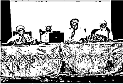
الشعراء خلال إلقاء قصائدهم

ازدانت شهباء الجامعة مساء يوم الأحد (١٨/٣/٢٠١٢م) بأسمية في الشعر الفصيح نظَّمها مركز الخليل بن أحمد الفراهيدي