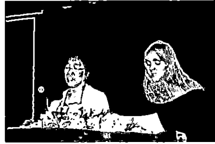
استاذة وطالبة تقرأن شعرا يابانيا

تواصلًا لفعاليات الموسم الثقافي الثامن، وفي إطار نشاط مركز الخليل بن أحمد الفراهيدي للدراسات العربية، نظّم المركز مساء يوم الأحد (١٨/٣/٢٠١٢م) أمسيةً هي الأولى من نوعها بعنوان "العالم يتكلم شعراً"،